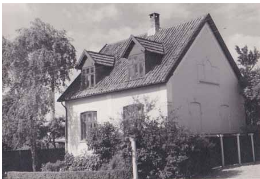
Dragshøj på Christiansbjerg i Aarhus